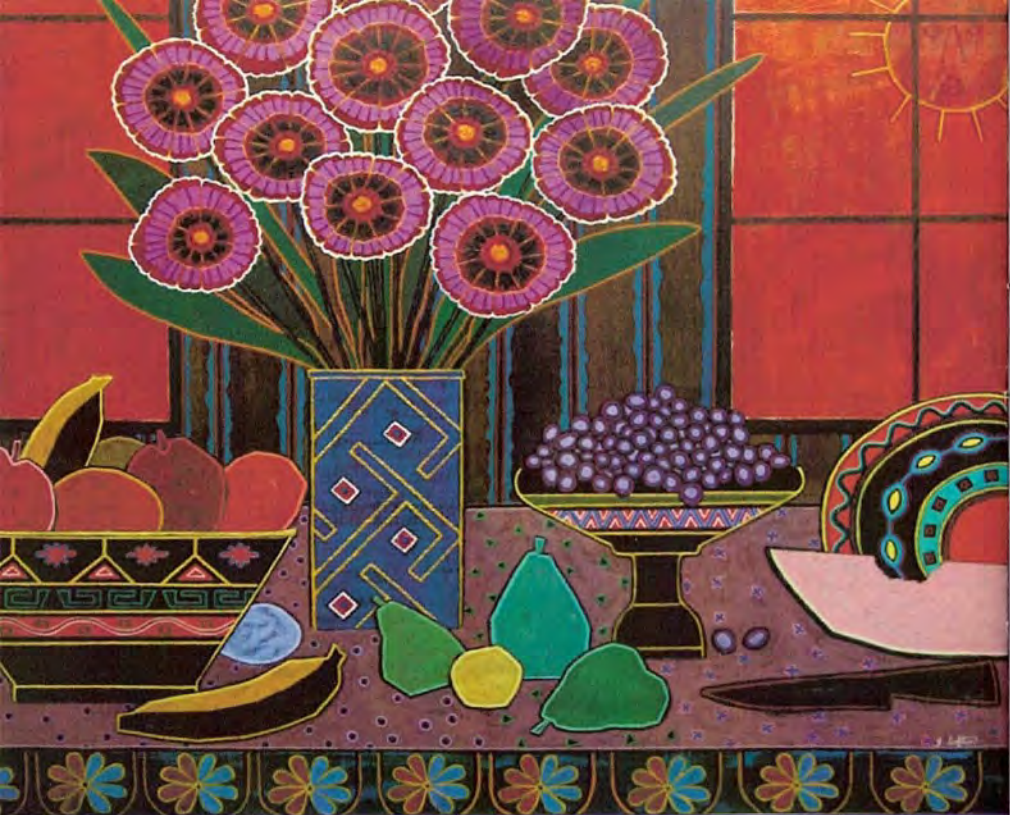
Flores y frutas