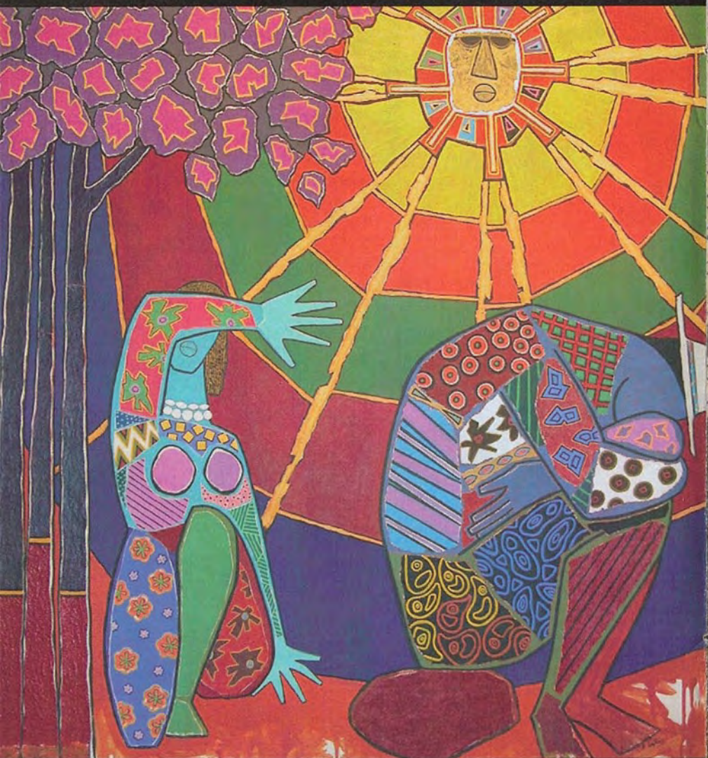
Angustia en el jardín